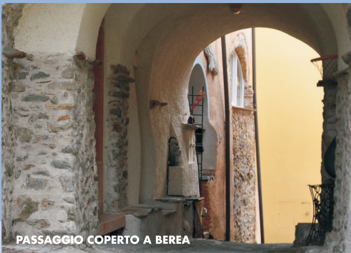
PASSAGGIO COPERTO A BERA