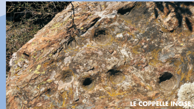
LE COPPELLE INCISE