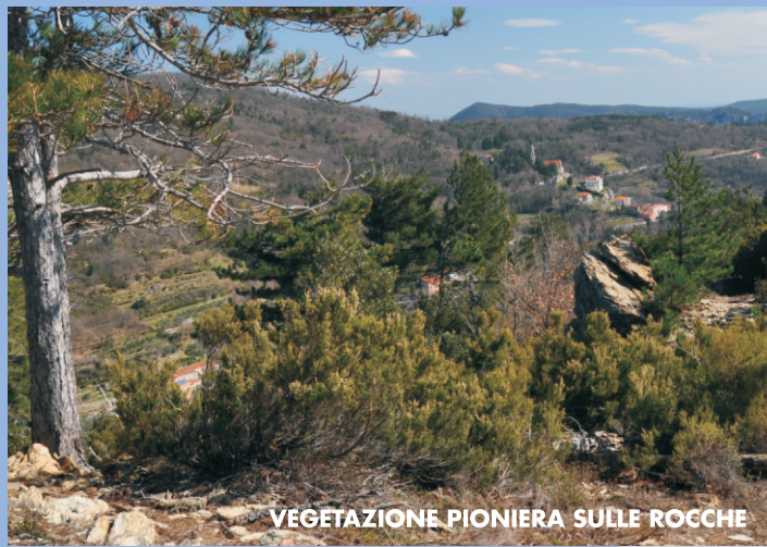
VEGETAZIONE PIONIERA SULLE ROCHE