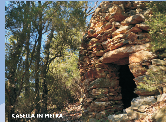
CASELLA IN PIETRA